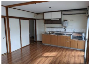
略図に付き現況優先